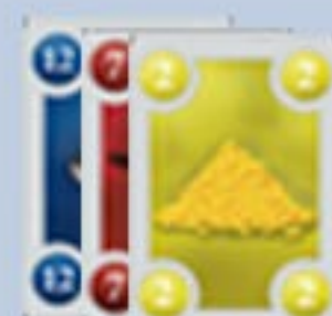
能力カード (1→13) 3色各1枚