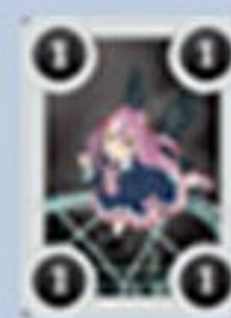
悪魔カード (1→13) 各枚